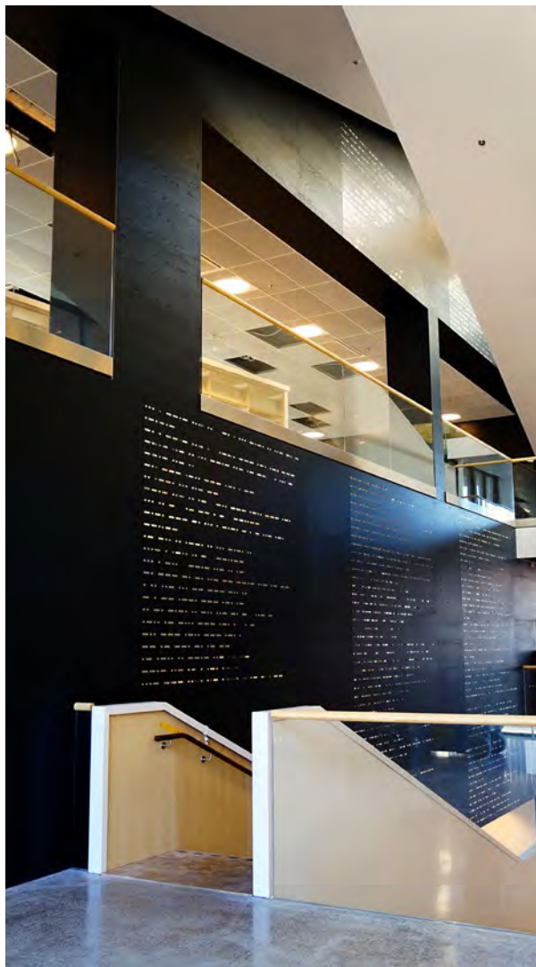
Konstverket "Lorem Ipsum" med morsealfabetet på svart panel av Kent Karlsson.