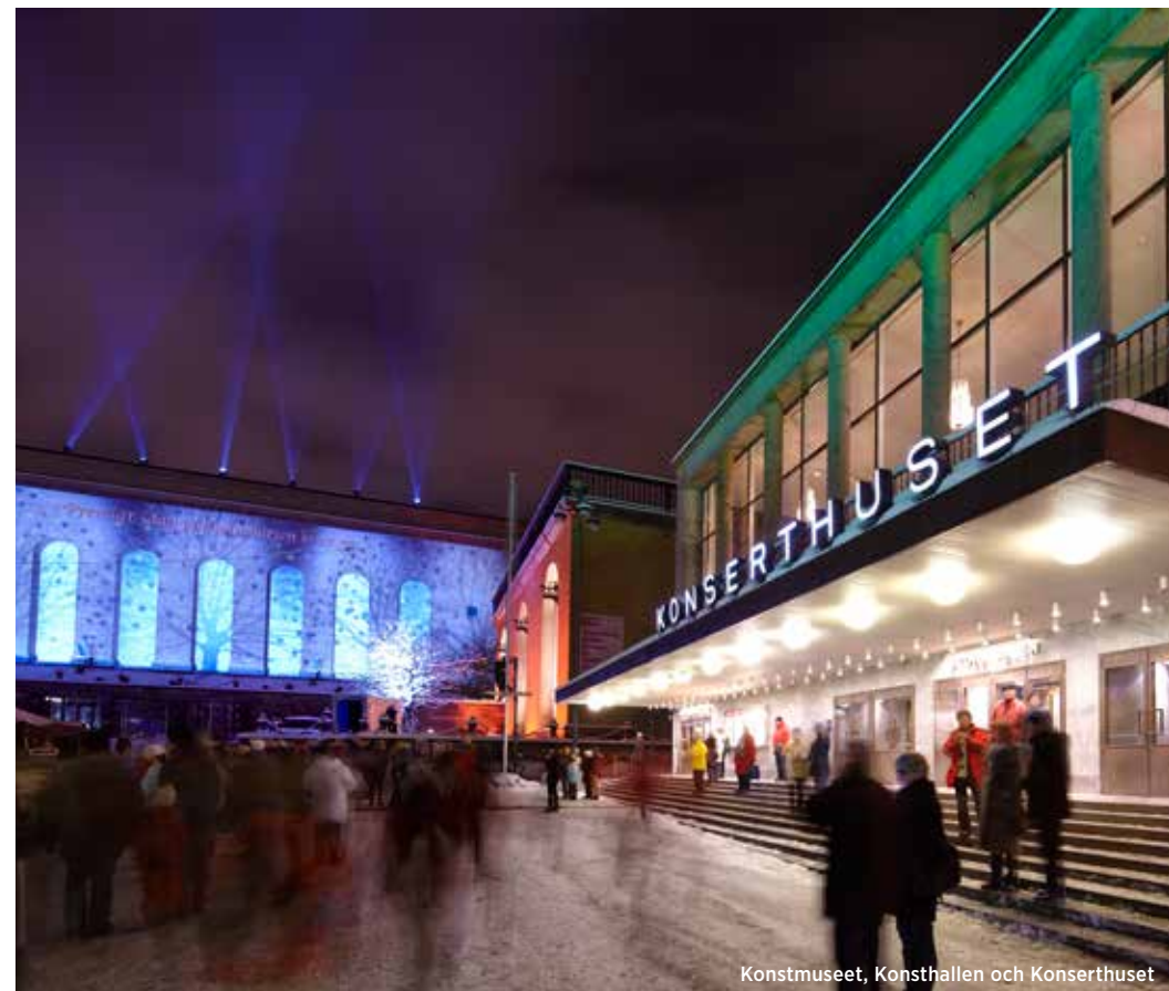
Konstmuseet, Konsthallen och Konserthuset

Byggnadsminne är det starkaste skydd som en byggnad kan få. För att en byggnad (eller en park eller bro) ska förklaras som byggnadsminne krävs att den har ett synnerligen högt kulturhistoriskt värde. Gathenhielska huset vid Stigbergstorget var det första huset i Sverige som fick detta skydd efter att lagen om kulturminnesskydd trätt i kraft år 1943. Det är länsstyrelsen som beslutar vilka byggnader som blir byggnadsminnen.